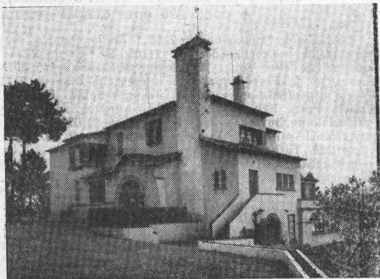
Pousada de Santo António de Serém (Vale do Vouga)