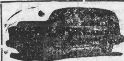
Auto-Fúnebre de Luxo com lugares

Funerais dos mais modestos nos mais luxuosos