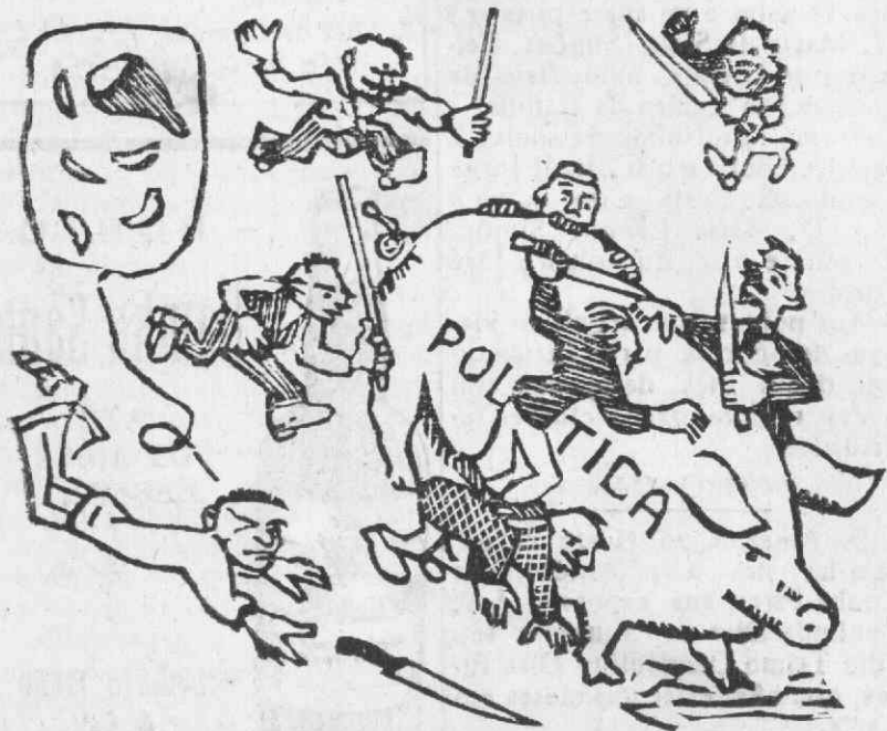
Neste fim de ano, o gordo «animal» percorre o mundo... e a «porca» não morre...

Oxalá que ao findar o ano de 1962 — se eu ainda pertencer ao número dos vivos — possa dizer: Bendito sejas para