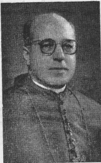
O falecido Bispo de Aveiro

Temos que nos conformar com as devastadoras arremetidas da Morte e que Deus lhe dê o eterno descanso, de que tanto é merecedor.