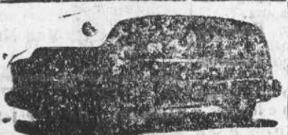
Auto-Fúnebre de Luxo com lugares

Funerais des mais modestos des mais luxuosos