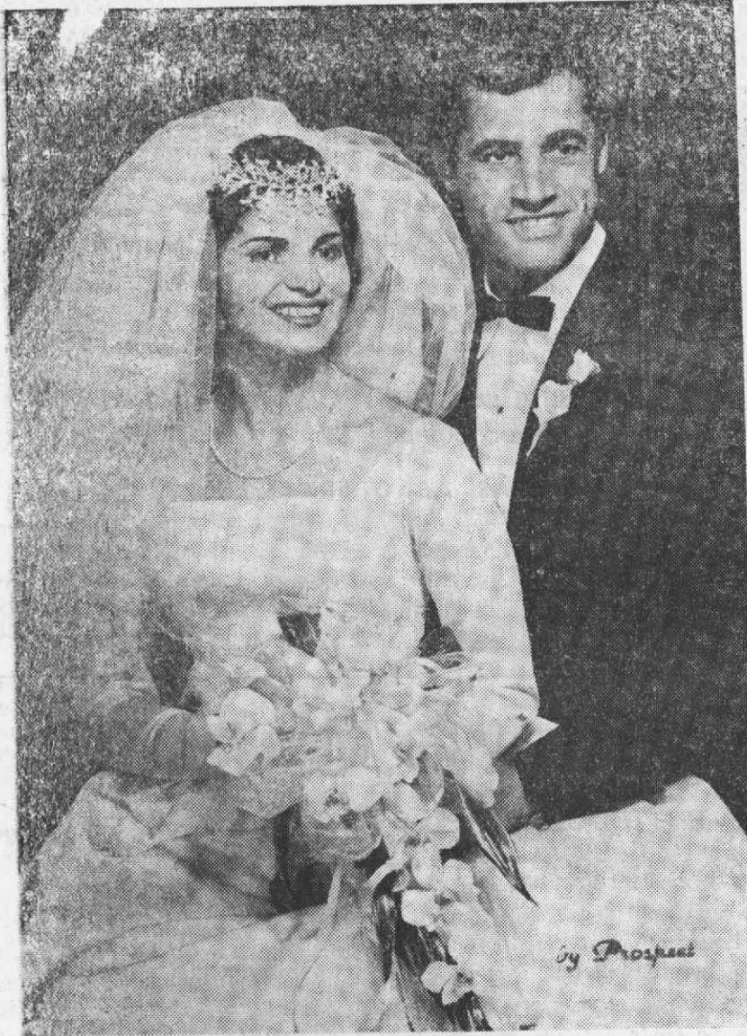
Os noivos após o acto religioso na América do Norte