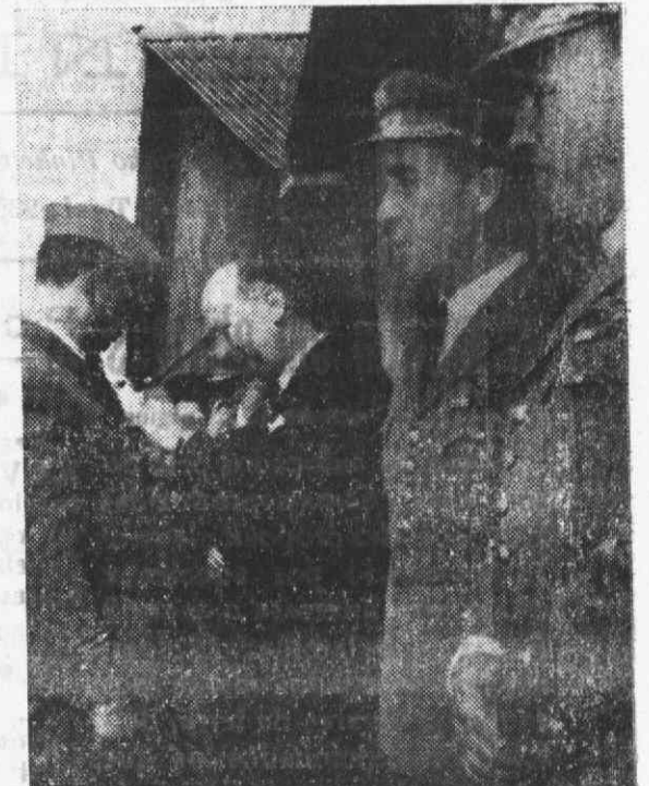
O Secretário de Estado da Aeronáutica, entregou os «Brevets» a novos pilotos da Força Aérea, na Base da Granja do Marquês.