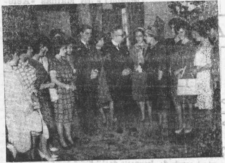
Os dirigentes da M.P.F. dos Centros Primários apresentaram cumprimentos ao Ministro e Subsecretário da Educação Nacional.