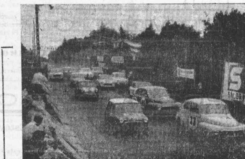
Os automovels de turismo em plena prova, no Circuito dos Montes Claros.

— Assim como o oxigénio é o pão da indústria, assim também o azoto é o pão da agricultura. E' com o auxílio do azoto que