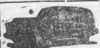
Auto-Fúnebre de Luxo com lugares

Funerais dos mais modestos aos mais luxuosos