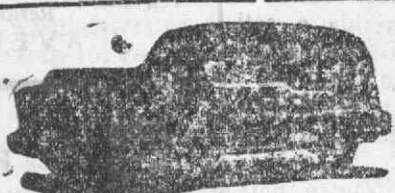
Auto-Púnebre de Luxo com lugares

Funerais das mais modestas das mais suntuosas