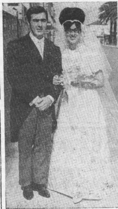
O novo casal