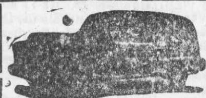
Auto-Fúnebre de Luxo com lugares

Funerais dos mais modestos aos mais luxuosos