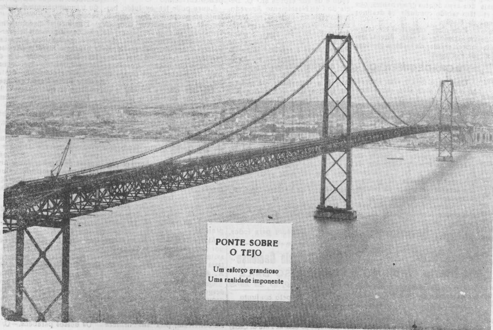
PONTE SOBRE O TEJO

Um esforço grandioso Uma realidade imponente