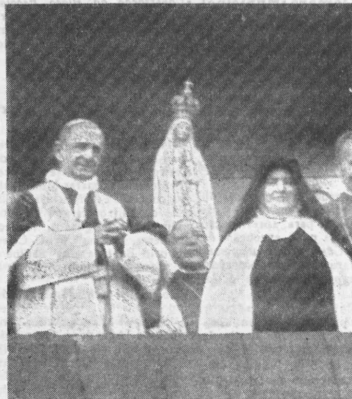
Uma fotografia que ficará para todo o sempre: — o Santo Padre Paulo VI e a vidente Irmã Lúcia, com a imagem alvinitente da Virgem de Fátima a abençoá-los, no inesquecível 13 de Maio de 1967.

O Papa veio a Fátima. E veio como um simples peregrino, orar, pleno de caridade, pela Paz do Mundo.