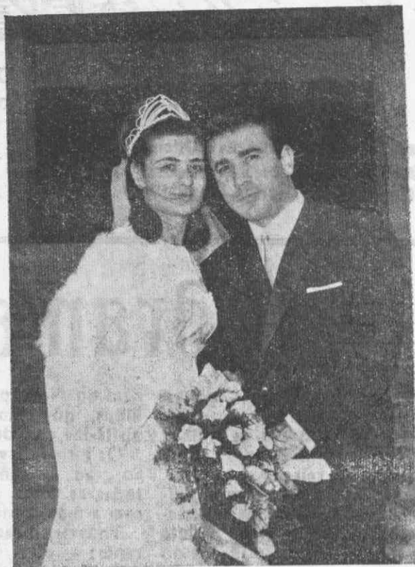
Os noivos após a cerimónia religiosa