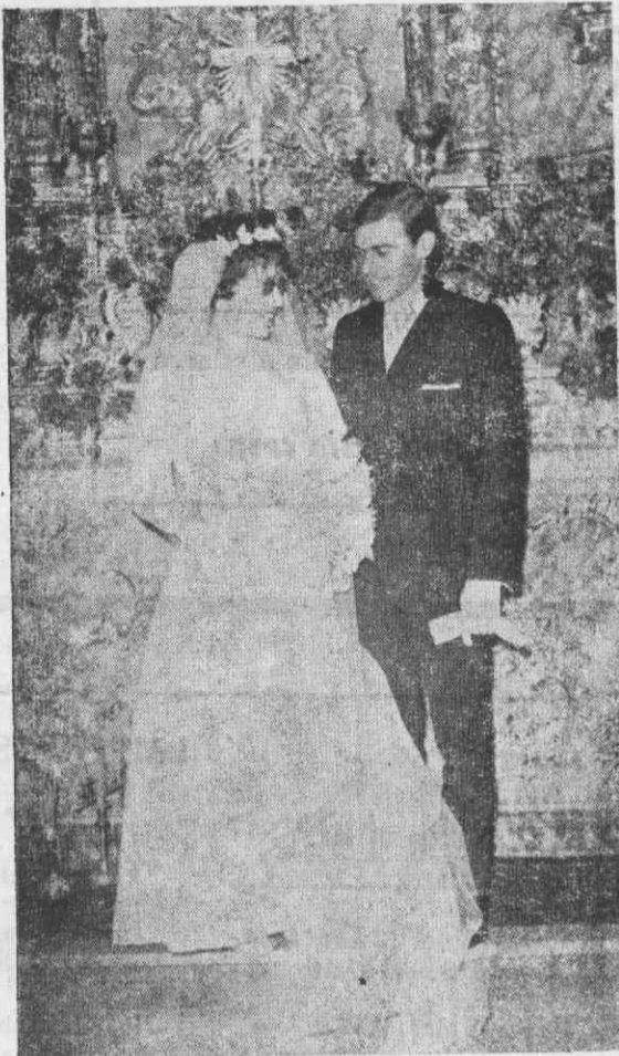
Os noivos após o acto religioso

Ao novo casal, que fazu residência em Avintes, desejamos um futuro repleto de felicidades.