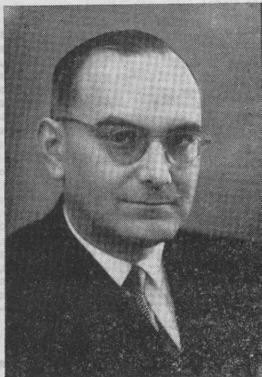
Prof. Dr. Marcelo Caetano

A nossa cooperação é imprescindível. Basta que as bandeiras de todas as facções partidárias se unam no mesmo elo.