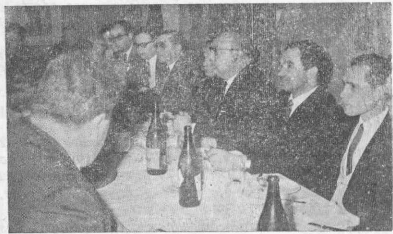
Um aspecto da sala onde decorreu o jantar de homenagem ao pessoal mais antigo da «RODOVIARIA»

Movimentaram-se, em Janeiro, 17.269 toneladas de mercadorias — 9.434 embarcadas e 7.835 desembarcadas, sem dúvida os maiores números até agora atingidos no nosso porto comercial.