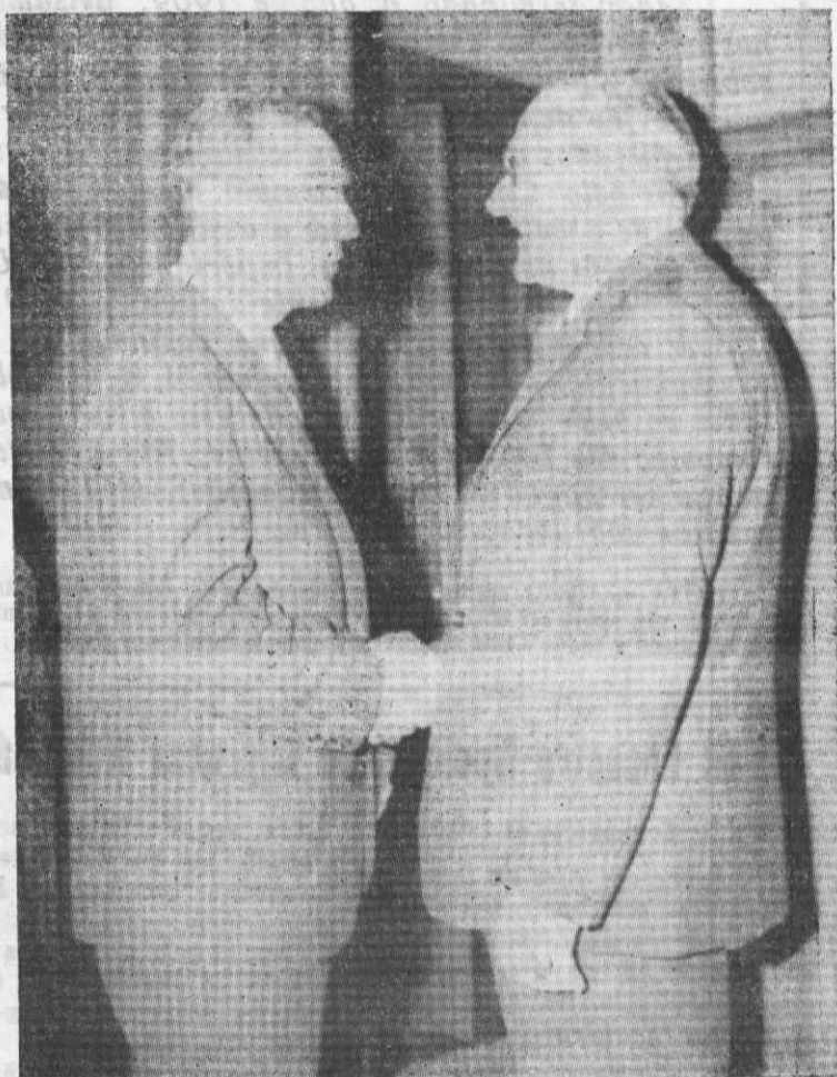
Na visita de cumprimentos, o nosso Director trocou breves palavras com o Presidente do Conselho