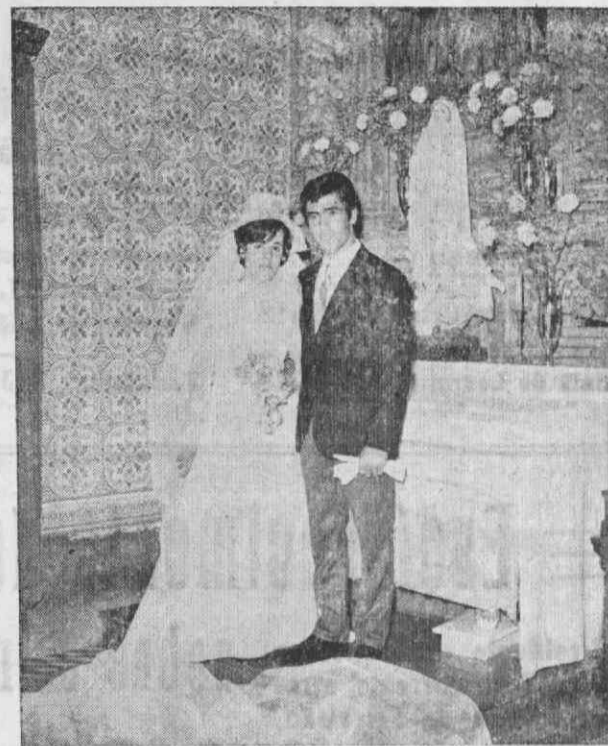
Os noivos após o acto religioso

Aos noivos, que andaram em viagem de núpcias e já se encontram nesta localidade, desejamos um futuro repleto das melhores felicidades.