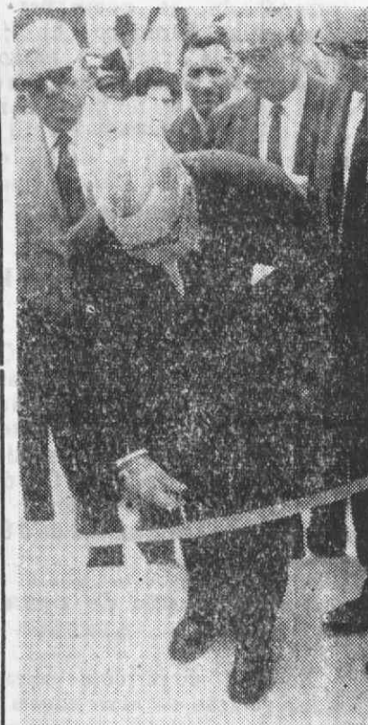
O Presidente da Câmara precede ao corte da fita