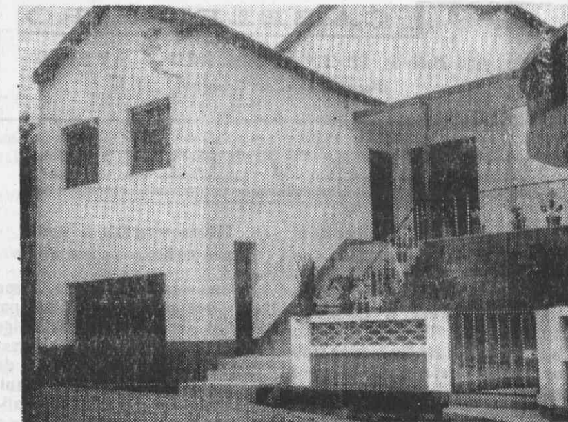
Frete da nova sede da Associação da Instrução e Recreio Angejense

A todos aqui deixo a expressão da minha homenagem de saudade e a amargura, per-