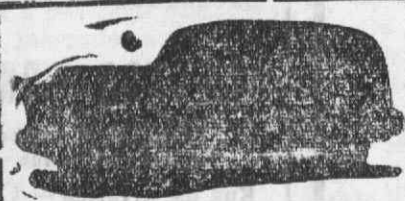
Auto-Funheira de Lãna com lugares

Traslada- ções para todos os cemitérios de País