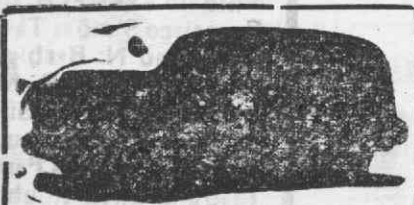
Auto-Funheiro de Lãno com lugares

Traslada- ções para todos os cemitérios do País