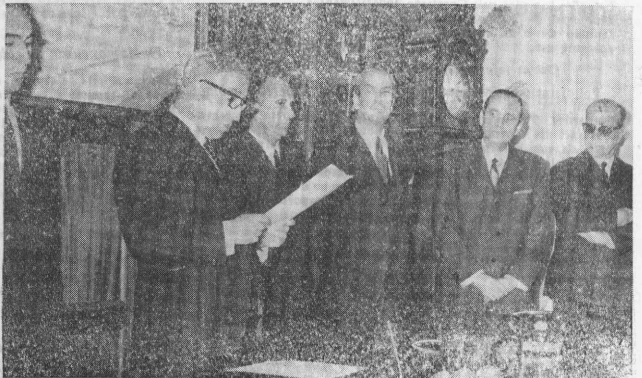
O Ministro do Ultramar, Prof. Dr. Silva Cunha, pronunciando o seu notável discurso no acto de posse dos novos secretários provinciais de Educação e de Saúde e Assistência de Angola.

Assistência, ao discursar durante o acto de posse dos novos secretários provinciais de Educação e de Saúde e Assistência daquela Província, respectivamente, os