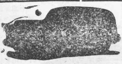
Auto-Funérea de Luto com lugares

Agência Funerária Capela de AMÉRICO DIAS CAPELA