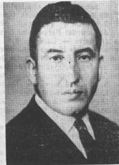
Prof. Dr. Silva Cunha

Este novo livro do Prof. Dr. Silva Cunha, editado pela Agência-Geral do Ultramar, com excelente apresentação gráfica,