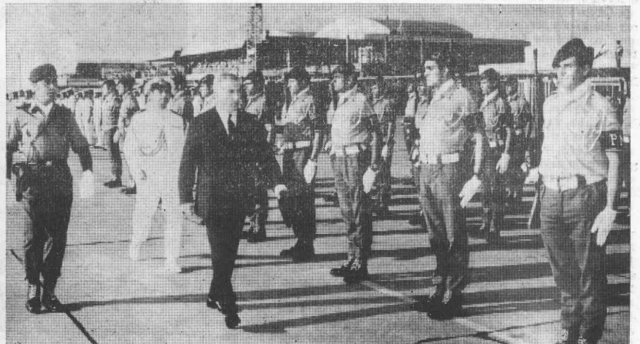
O Ministro do Ultramar, Prof. Dr. Silva Cunha, passando revista à guarda de honra, após a sua chegada a Lourenço Marques