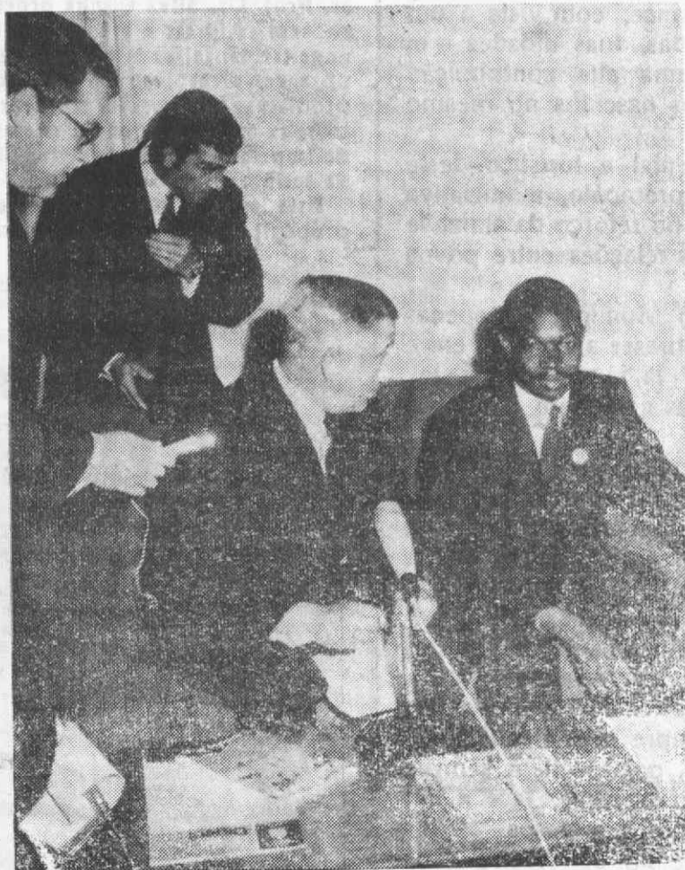
O Ministro do Ultramar, Prof. Dr. Silva Cunha, com o Ministro das Finanças do Malawi, Dr. Aleke Banda, tiveram importante reunião, pouco depois da chegada do governante português.