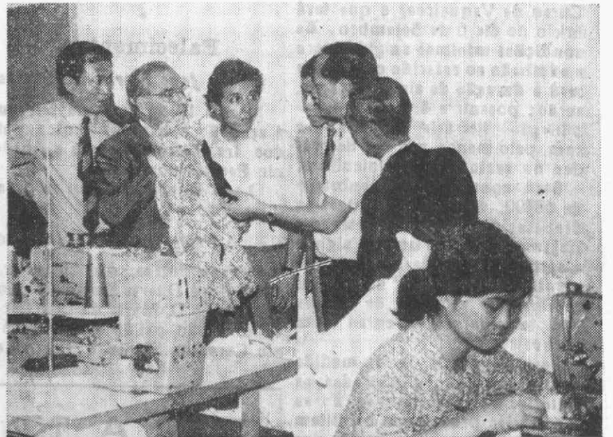
Aspecto dos contactos estabelecidos entre os elementos da Missão Francesa do Centro de Produtividade das Indústrias de Vestuário com os industriais têxteis de Macau, com vista ao incremento da exportação dos produtos deste sector daquela Província para França.

Esta visita foi patrocinada pela Federação das Indústrias «Aparel» Francesa, com o objectivo