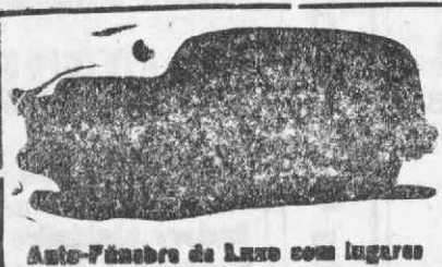
Auto-Funébre de Luxo com lugares

Trasladações para todos os comitérios do País