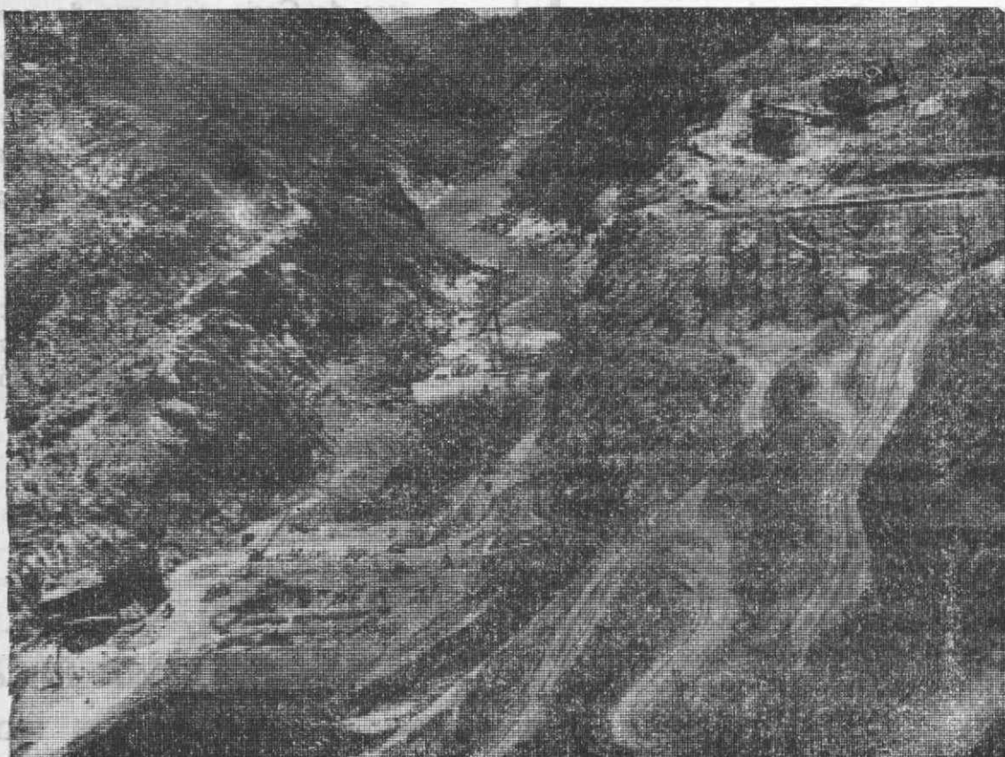
Vista geral da construção da Barragem de Cabora-Bassa, em Moçambique, cujos trabalhos se processam no melhor ritmo cumprindo os prazos e de acordo com o programa estabelecido.