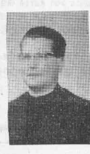
Padre José Vaz