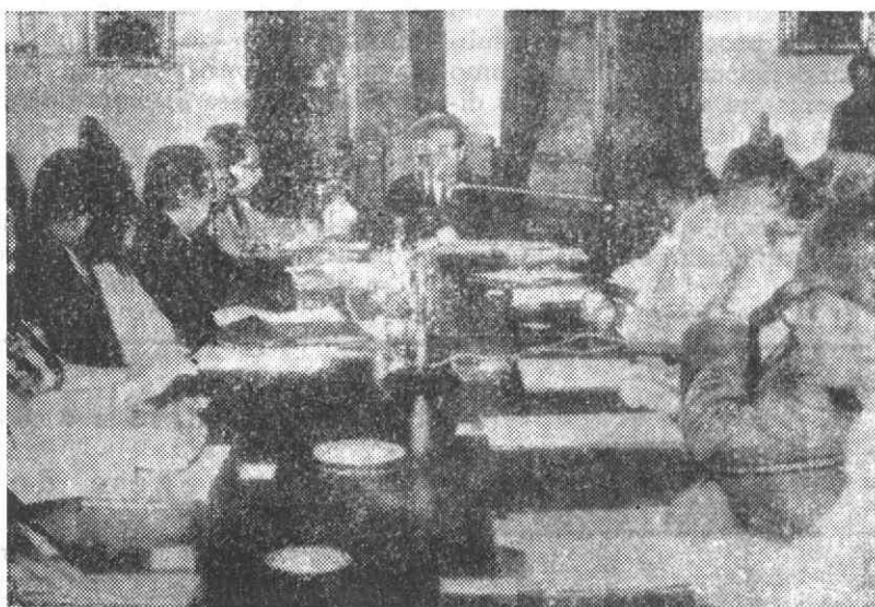
Um aspecto da Assembleia Legislativa da Guiné