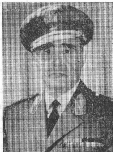
General António de Spínola

tir o exercício de todos os direitos e liberdades dos cidadãos; observar e fazer cumprir as Leis; promover o bem geral da Nação; e defender a independência da pátria portuguesa.»