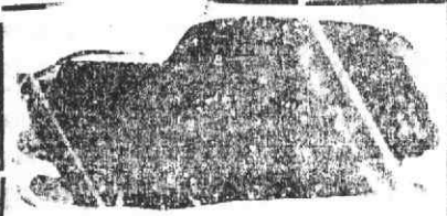
Auto-Fábrica de Lã e de Lã leve

Agência Funerária Capela de AMÉLIO DIAS CAPELA