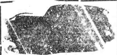
Auto-fábrica de honras e capelas

Rua Vicente de Almeida, 70 e 80 Esgueira e Armazém: Rua do Gado, 10 e 14 AVEIRO Telef. permanente 23284 ESGUEIRA