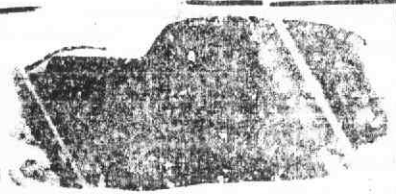
Auto-Função de Lisboa 1482728

Tratada especialmente para todos os cerimónias de País