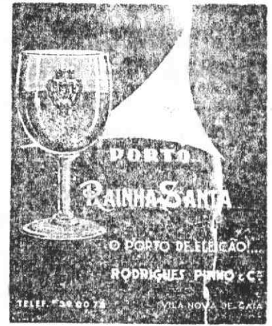
RODRIGUES PINHO & C ª

Grande sortido de calçado para Homem, Senhora e Criança, das melhores marcas aos melhores preços.