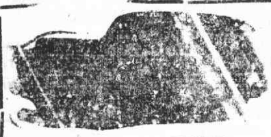
Auto-Funeral de baixo custo

Funerais dos mais modestos aos mais luxuosos