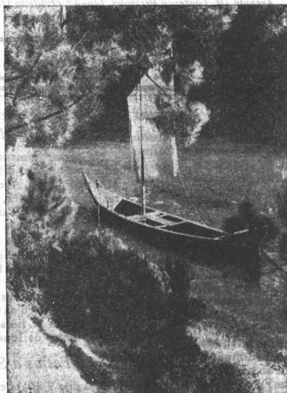
Aprazível paisagem do Vouga, próximo da Ponte de Santiago (Sever do Vouga)